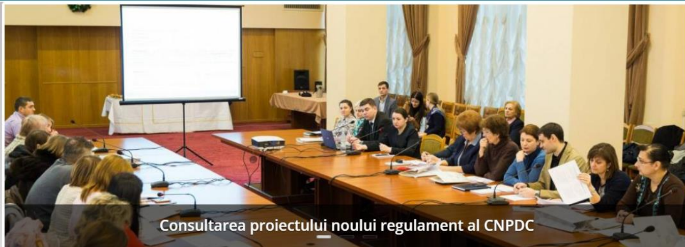
Consultarea proiectului noului regulament al CNPDC